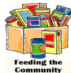
Feeding the Community