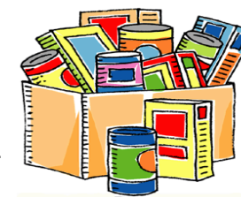
Feeding the Community

Estamos aceptamos alimentos no perecederos y artículos de higiene personal para los las personas con necesidad de nuestra comunidad . Si desea ayudar, puede llevarlo a la oficina durante la semana o a la Iglesia el domingo. Gracias.